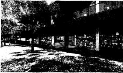
ジョー・テラス・オオサカの外観